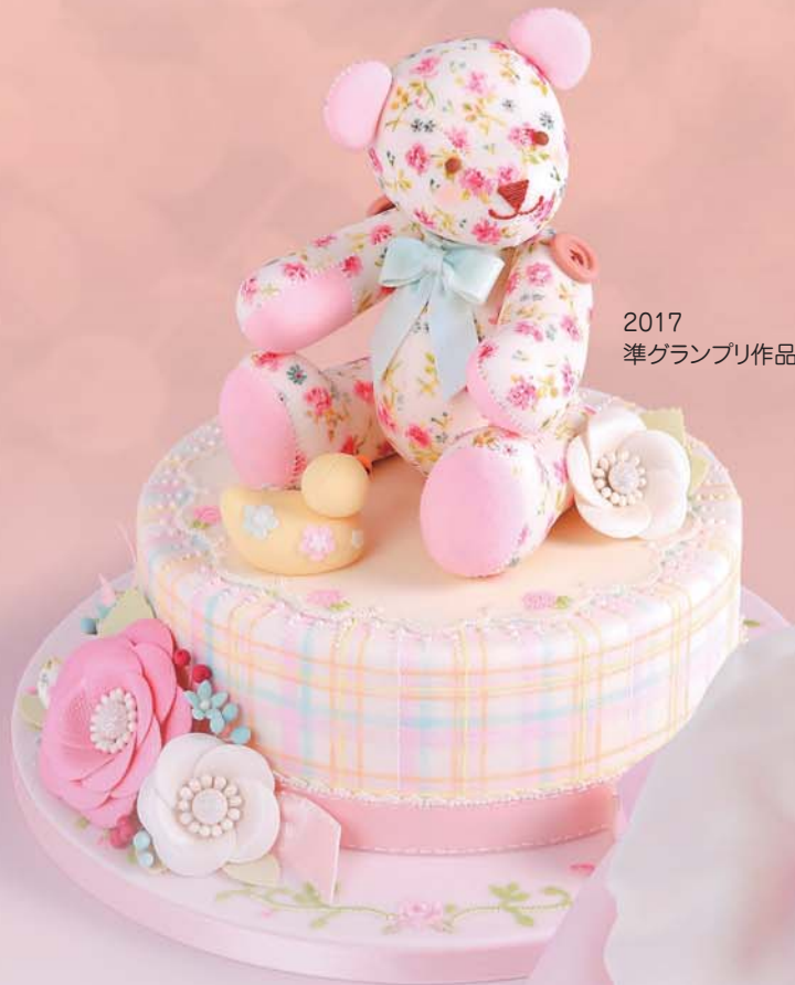
2017 準グランプリ作品

入場料 一般:1,200円(前売り1,000円) 会員:1,000円、中学生以下無料